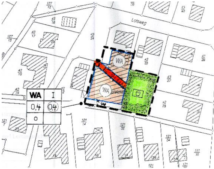
Abbildung 3: Ausschnitt Bebauungsplan Nr. 12 W, 2. Änderung (Ratsbeschluss 22.09.2004, in Kraft getreten am 15.12.2004)

Mit Datum vom 22.09.2004 wurde mit der 2. Änderung des Bebauungsplanes Nr. 12 W ein Teil des Spielplatzes in ein Allgemeines Wohngebiet umgewandelt. Die Erschließung der Grünfläche wird über ein Geh- und Fahrrecht gesichert. Die Baugrenzen verlaufen weitgehend entlang der Grundstücksgrenzen.