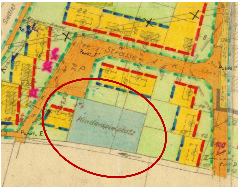
Abbildung 2: Ausschnitt Bebauungsplan Nr. 12 W (1964)

Die Bauflächen innerhalb der angrenzenden Allgemeinen Wohngebietes (WA) weisen städtebauliche Werte mit einer GRZ von 0,4, einer GFZ von 0,4 und einem Vollgeschoss auf. Entlang der Straßenverkehrsfläche wird mittels einer Baulinie ein einheitliches Siedlungsbild vorgegeben; die Bautiefen betragen 15 m und werden von einer Baugrenze abgeschlossen.