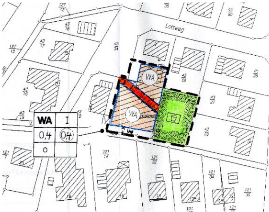
Abbildung 3: Ausschnitt Bebauungsplan Nr. 12 W, 2. Änderung (Ratsbeschluss 22.09.2004, in Kraft getreten am 15.12.2004)